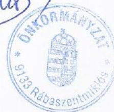
Németh Szabolcs polgármester